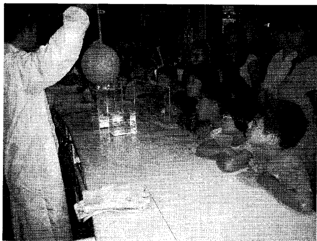
図1. 仙台市科学館での「特別実験教室」の風景（酸素の液化実験）。