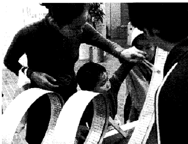
図 3. 片平まつりの風景。磁気浮上列車模型の体験。

した。多くの高校生が低温でおきるふしぎな物理現象に驚き、デモンストレーションをしてくれた学生達の説明に熱心に聞き入っていました。