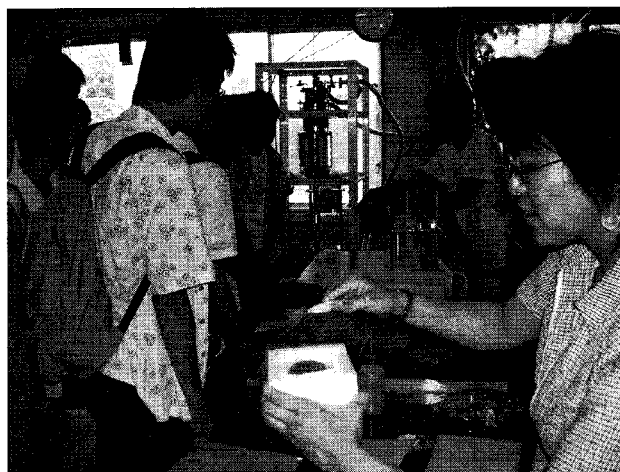
図 2. オープンキャンパスの風景。手前は高温超伝導物質の浮遊実験のデモンストレーション。

青葉山地区の極低温物理学部は本年も理学研究科のオープンキャンパスに参加し、高校生向けに低温関係の簡単な公開実験を行いました。オープンキャンパスはこれから東北大学を志望しようとする高校生向けに、大学の授業内容や研究内容を知ってもらうために一般公開する目的で行われています。期間中、実験室には来場者が途切れることなく訪れ、混雑時には行列ができるほど盛況で