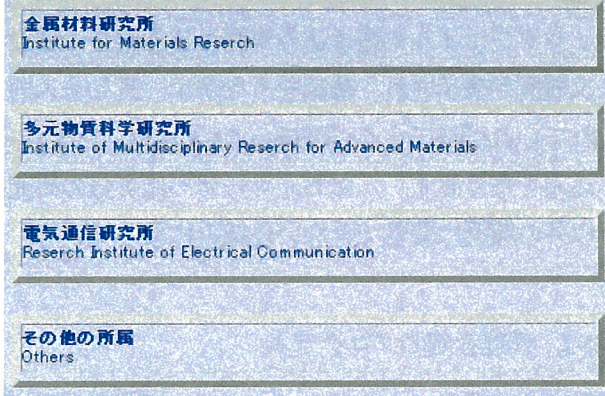
図2 申し込み入り口のページ表示例。