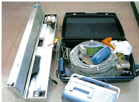
図4. 海外施設における中性子実験用にパックされたインサート。図中左手のアルミケースに収められている。

の方がコイル用のスペースがあり、そのためより抵抗の少ない太い線材で巻くことが出来るためである。先にも述べたが、ミニパルス磁場では、最高磁場はコイルの機械的強度ではなく、発熱によって制限されていることが多いのである。