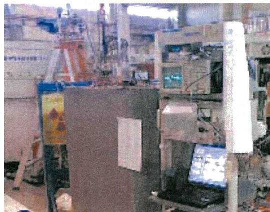
図 2. 原研におけるパルス磁場中性子回折装置の写真。左手奥の脚立の向こうがオレンジクライオスタット。手前の灰色の箱はコンデンサ電源。

磁場発生の原理は通常のパルス磁場コンデンサバンクと同様である。パルス磁場は、図1のようにコンデンサに蓄えた電荷をコイルに瞬時的に放電することにより、半サイン波形の磁場を発生する。原研の3号炉で用いる電源のスペックは、エネルギー24.3 kJ(容量5.4 mF、充電圧3 kV)で、自作したものである。大きさは、 0.7 \times 0.7 \times 1.4 \text{ m}^3 で、ユニット式となっており、分割して自家用車で運搬できる設計である[5]。