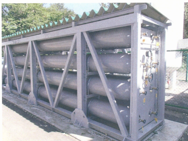
図1 極低温物理学部に新たに設置された長尺カードル。

青葉山地区では、今後の需要増に対応するため、平成25年3月に、ヘリウムガスを貯蔵する長尺カードルを増設しました。巻頭言にもありますように、最近ヘリウムの供給状況は不安定で、突発的に入手困難な状態になる事態も懸念されます。今回の増設は、供給能力の増強もさることながら、ヘリウムの供給不足に対する備えを強化することにもつながるものとなります。