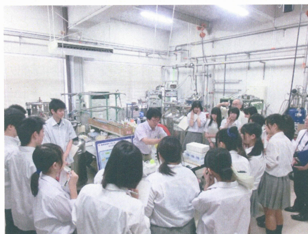
図2 宮城県工業高校化学工業科見学における、液体窒素を用いた実験の様子。

そうなのですが、実際に体験するのは別らしく、見学時間を超えて低温の世界を楽しんでいました。