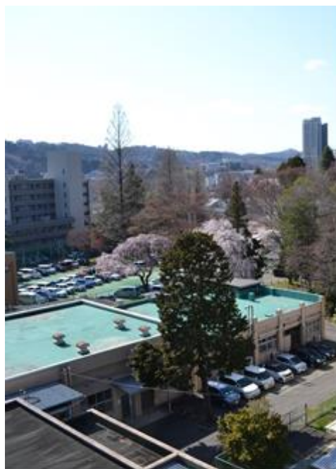
極低温科学センターと旧理学部植物園 (平成 27 年 4 月撮影)

あまり目立たない場所に建っていた。平屋のコンクリートの建物が 2 棟建ち、南側にヘリウムと水素の液化棟が、北側には研究者が出入りする実験棟が配置されていた。その後、10 年目の昭和 56 年に岩石、地質学教室の赤煉瓦が取り壊され、強磁場超電導材料開発施設が建ったが、低温センター自体は基本的にはその頃の姿と変わっていない。ただ、内部は今よりはずっとシンプルだった。