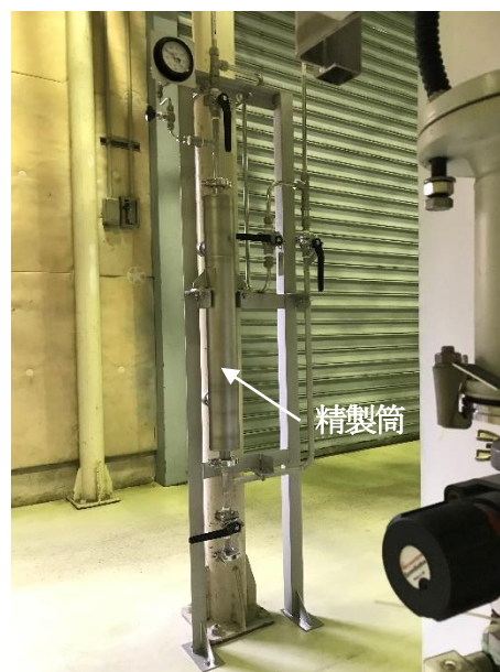
図7 低温科学部ヘリウム液化システムに導入された水素除去装置(精製筒内の水素吸着剤として銀ゼオライトを使用)

3代目液化機の稼働2年目に、液化機内に固体水素が蓄積し、それが供給するヘリウム中に混入した結果、多くのユーザー低温装置を詰まらせるという問題(いわゆる水素問題)も生じた。これにより、片平地区では一時的なパニック状態となり、センターへ苦情や対応策に関する質問の電話が殺到する状況となった。購入業者の協力も受けて調べたところ、これは液化機本体の構造に由来するも