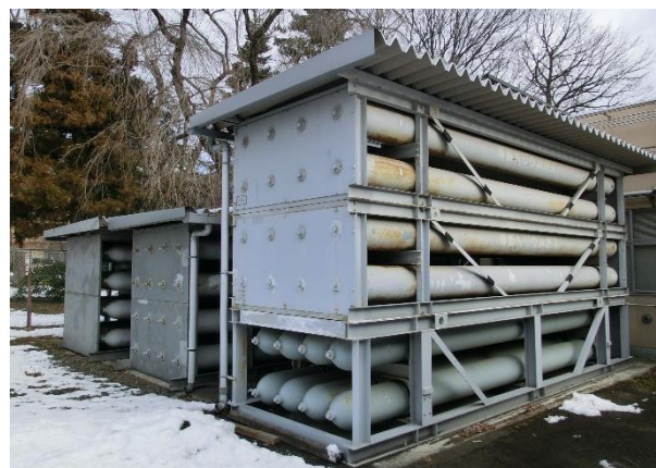
図4 回収ガス長尺カードル群