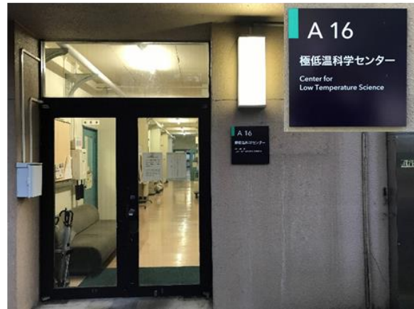
図8 極低温科学センター低温科学部建屋全景の比較 (左上図：2021年、右上図：1973年理当時)、現在のヘリウム容器受取り入口 (左下図) と玄関 (下図)

えながら述べてきた。近年、冷凍機技術の普及により液体ヘリウムを使わなくても、4K以下の極低温環境が得られるようになり、液体ヘリウムの需要は減少するものと予測されてきた。しかし、東北大学の現状として需要の増加の傾向は止まるまでには至っていない。冷凍機の維持に必要な電気・メンテナンス料金とセンターの供給するヘリウム料金の比較や、それぞれの実験方法の利点と欠点を勘案すると、今後液体ヘリウムと冷凍機をつかった実験装置の比率はある値でバランスするのではないかと予測している。液体ヘリウムの学内需要(あるいはこれからは学外も視野に入れる時代にはいるかもしれない)がある限り、これに答えるべく、極低温科学センターの運営を維持していきたいと考えている。ユーザーの皆様のお力添えを切にお願いする次第である。