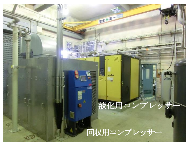
図2 低温科学部3代目ヘリウム液化機（上図）と液化用、回収用コンプレッサー（下図）

小分け容器に液体ヘリウムを汲み込める仕様となっている[1]。このヘリウム液化システムは1971年（昭和46年）低温センター発足時に導入されたものからかぞえて3代目（1952年に日本で初めて金属材料研究所に設置された液化機も含めると4代目）となり、1台の液化機としては国内でも最大級の供給量を出す程の稼働状況にある。10年以上にわたる高い稼働率での運転に伴い、液化機本体の故障が2018年度頃より散見されるようになった[2]。幸いにも極低温科学センター関係者や金研および大学本部事務部の方々をはじめとした関係