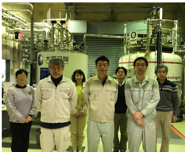
図1 低温科学部スタッフ

現在稼働しているヘリウム液化機は2009年度に導入された、Linde社のL280-S型であり（図2）、200L/hの液化能力に加え、容量5,000Lの液体ヘリウム貯槽からポンプを用いて約20L/分の速度で